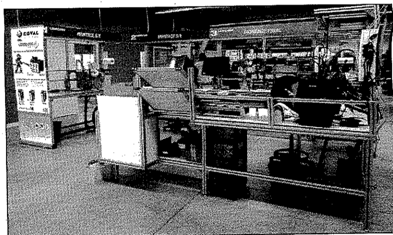
La production est organisée en îlots pour plus d'efficacité.

Pour atteindre son objectif, la Pme drômoise spécialisée dans la conception de solutions de manipulation par le vide pour l'industrie entend multiplier les initiatives et ce, dans de nombreux domaines.