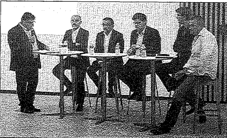
La seconde table ronde de cette soirée était consacrée au contrat global de performance. Un dispositif particulièrement adapté quand il s'agit de concilier construction ou rénovation de bâtiments et performance énergétique selon les différents intervenants invités pour en débattre.