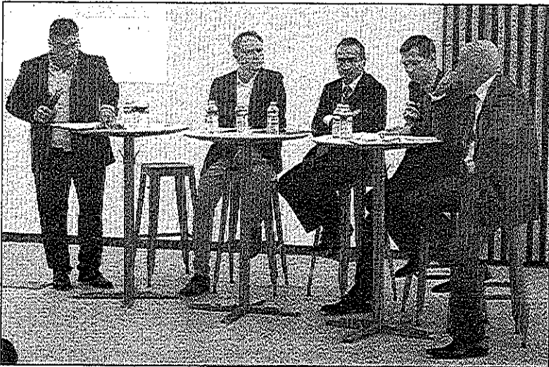
Le thème abordé lors de cette 1 ère table ronde a suscité l'unanimité. Construire ou rénover en favorisant de hautes performances énergétiques crée de la valeur ajoutée.

DE L'INTÉRÊT DE CONSTRUIRE OU DE RÉNOVER DES BÂTIMENTS AVEC DES HAUTES PERFORMANCES ÉNERGÉTIQUES: TEL ÉTAIT LE THÈME DE LA CONFÉRENCE-DÉBAT PROPOSÉE CE MARDI PAR ICARE DÉVELOPPEMENT. ELLE FUT L'OCCASION POUR LES DIFFÉRENTS INTERVENANTS PRÉSENTS DE RAPPELER, À JUSTE TITRE, Ô COMBIEN S'INSCRIRE DANS CETTE DÉMARCHE EST PERTINENT.